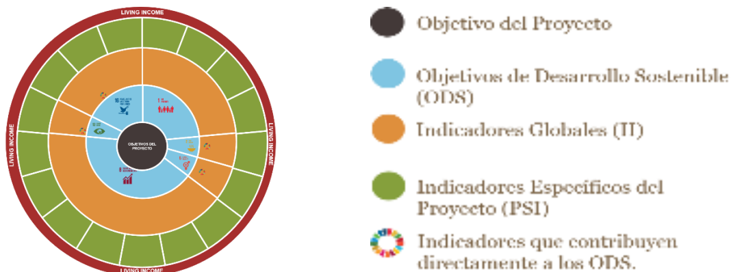
Figura2. Alineación de Indicadores- Proyecto- Heifer-ODS.